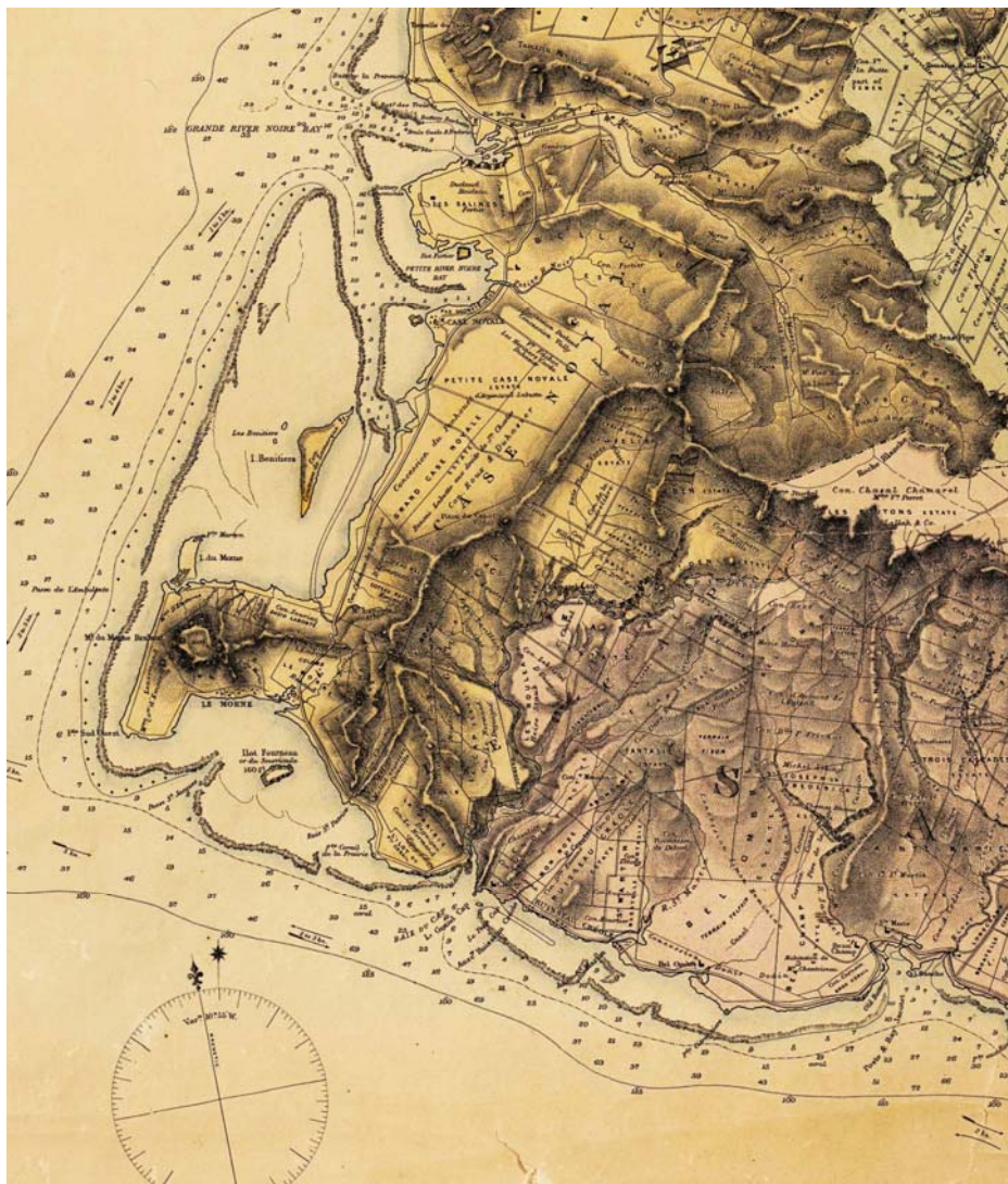
Carte 1 : le secteur de la Rivière des Citronniers et du Poste Jacotet

La société obtint à peu de distance des bords de la mer six terrains d'habitation « en consentant la réunion au domaine d'une pareille quantité de terre en d'autres quartiers ». Estienne Boldger décrit les lieux comme étant une petite plaine sablonneuse, dépouillée de bois près du bord de la mer. Ses premiers soins furent d'assurer « la subsistance de sa peuplade ». Il commence à pratiquer des cultures puis établit une communication entre ce champ et la mer car la voie maritime était le seul moyen de communiquer avec le chef-lieu de la colonie, « le défaut de chemin rendant le transport