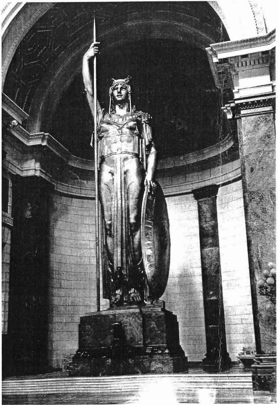
Estatua de la Libertad. Capitolio de La Habana